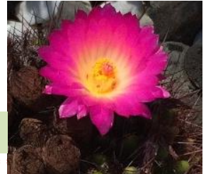
サボテンの花ー たぶん[春雷]という品種

海の日を含めた三連休は、全国各地で猛暑日を記録。神奈川県も不用意に外出すると、倒れてしまうのではないかと思うほどの気温でした。冷房の効いている建物から扉を開けて外に出ようとすると、熱気(熱風)で押し返されるようでした。しかし、そのような中でも、子ども達は元気に講座に参加です！