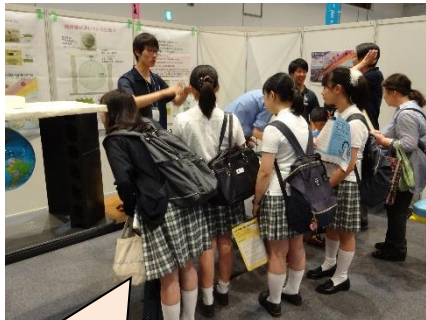
こちらサイエンスフェア見学中の生徒達。身乗り出して展示ポスターを見ていました。

今年はこの講座に71名(中学生33名、高校生38名)が登録しています。理工系分野に興味を持っている生徒ばかりです。学校が夏休みになる期間を中心に、右の予定で会員さんの施設を訪問させていただきます。事務局職員もお伺いするのを楽しみにしております。よろしくお願いいたします。