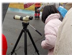
遠くの野鳥は、講師の望遠鏡を借りて観察しました