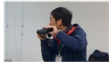
双眼鏡は科学部から持参したので全員手ぶらでOK