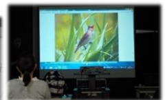
観察した野鳥の種類の確認と解説