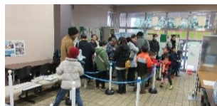
相模原市立青少年学習センター