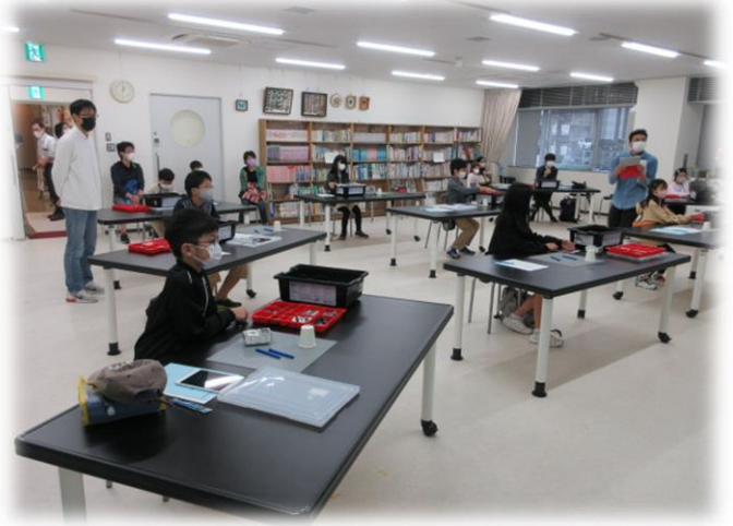
10月17日(日)神奈川工科大学 ☒ 参加者:小学1～3年生10名、小学4年～高校3年生10名