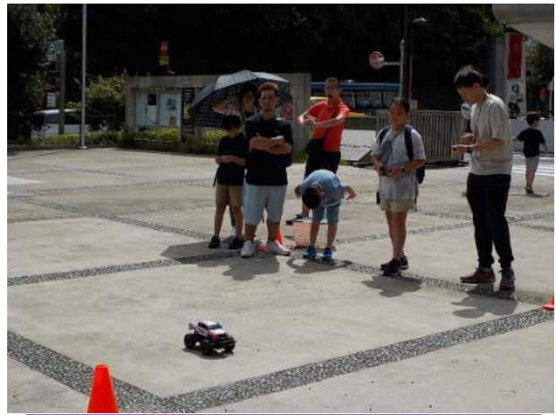
「ラジコンわくわく体験(外) ラジコン」 (青少年センター科学部) 広いコースでのラジコンの操縦に、子どもたちは興奮している様子でした。