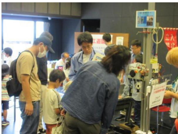
「宇宙エレベーターの展示と操縦体験」 (神奈川大学) 天候が不安定なため、スタジオ HIKARI で行いました。鉄塔昇降ロボットの操縦は大人も興味津々でした。

1階では神奈川工科大学、東京工芸大学、ロボテナ、ロボットゆうえんち、オリジナルマインド、磯子工業高等学校定時制・向の岡工業高等学校定時制、科学部の出展があり、どこのブースも多くの人でにぎわっていました。