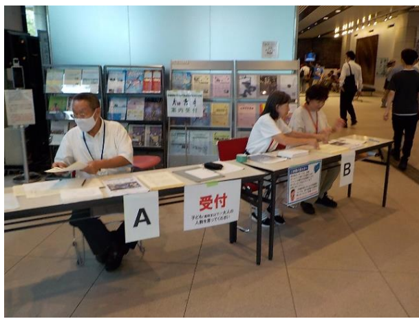
1階受付 当日は神奈川県庁の関係部署からも応援があり、多くの来場者に対応することができました。