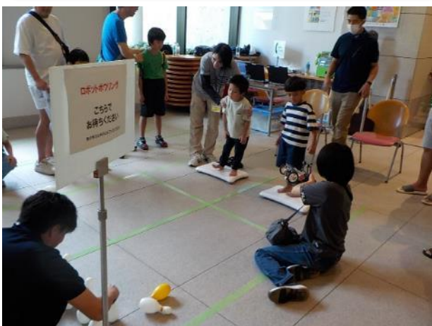
「ロボットボウリング」(神奈川工科大学) レゴマインドストームというロボットの操縦体験をしました。任天堂のバランス Wii ボードに乗り、ロボットを操作し、ボウリングのピンを倒します。操縦が中々難しく、参加者は一生懸命バランスをとりながら操縦していました。