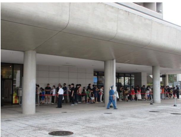
1階入り口の様子 10時前の様子です。今年度は、整理券配布はありませんでしたが開場前から来場者が列を作っていました。