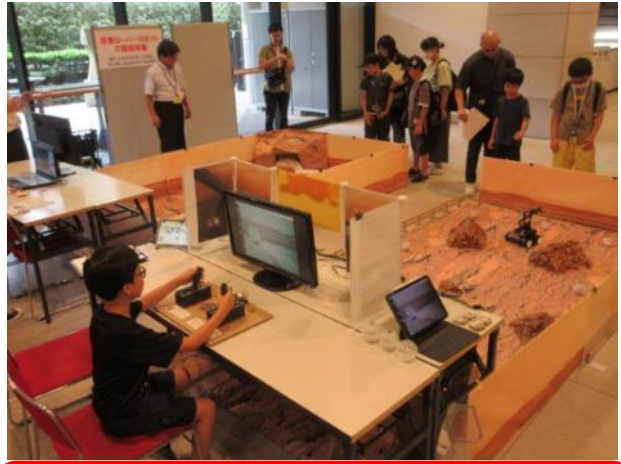
「探査ローバーロボットの操縦体験」 (磯子工業高等学校定時制・向の岡工業高等学校定時制) 探査ローバーロボットを操縦して、惑星探査の疑似体験に子どもたちは夢中でした。コースの作りが素晴らしかったです。