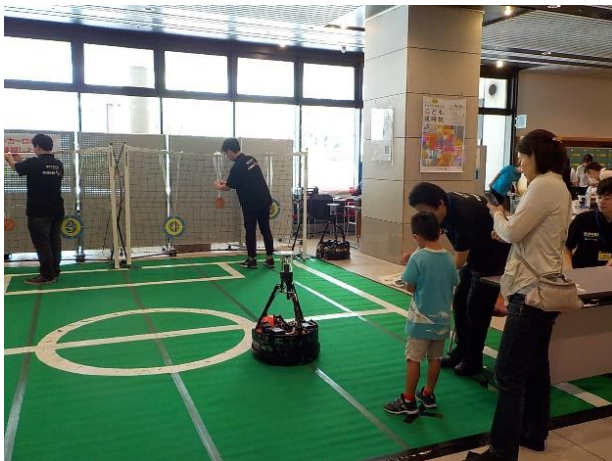
「サッカーロボットを操縦しよう！」 (東京工芸大学) サッカーロボットを操縦して、めがけてシュート！ 高得点を目指して子どもたちは大興奮でした。