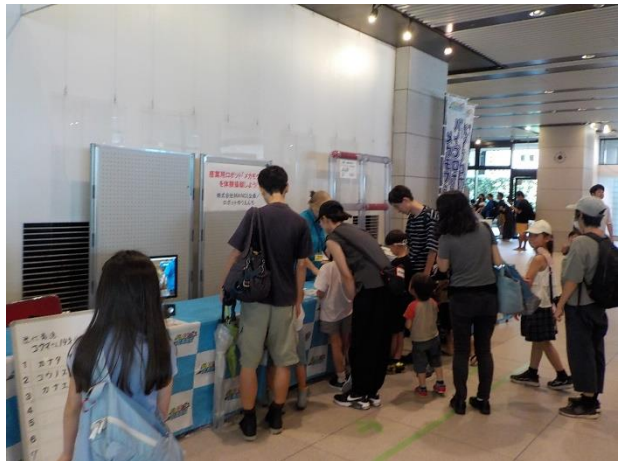
「産業用ロボット「メカモグラ」を体験操縦しよう」 (ロボットゆうえんち) 子どもたちは「パイプロボットの「メカモグラ」の操縦体験を楽しんでいました。