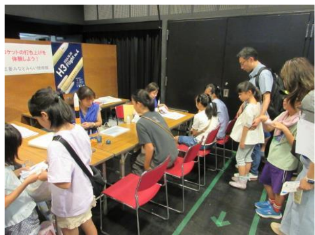
「ロケットの打ち上げを体験しよう！」 (三菱みなとみらい技術館) 電気分解によって作られた水素を爆発させ、小さなロケットを飛ばします。子どもたちは、とても喜んでいました。