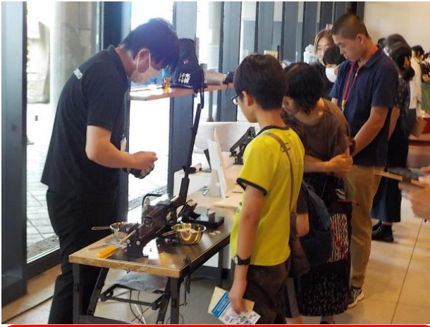
「廃プラ再生体験ワークショップ」 (株式会社オリジナルマインド) ペットボトルキャップからロボットマグネットをつくるワークショップを体験しました。廃プラスチックをどのように活用できるか、楽しく学ぶことができました。