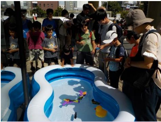
「ラジコンわくわく体験(外) ラジコン×水」 (青少年センター科学部) プールにはった水の中で、潜水艦などの操縦体験が出来ました。