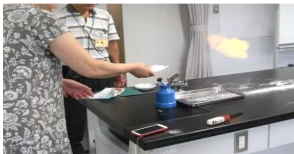
理論を学んでから、いよいよ実習です。コーンスターチの燃焼実験です。そのままでは燃えませんが、霧状にすると…ポッ！