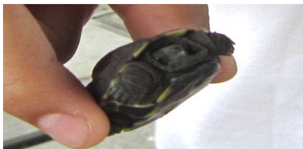
アカミミガメ？の子どもです。外来種ですが鶴見川で繁殖しているのでしょうか…？生態系が心配です…。