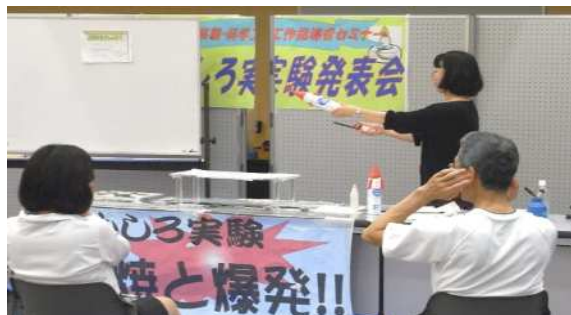
発表会です。水素と酸素の爆発実験。空き缶を土台にボール紙で作ったロケットを飛ばします。ボンッ！