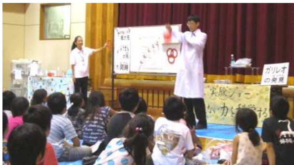
「ガリレオの発見」 [横須賀会場] 風船と板を同時に放すとどちらが先に落ちるでしょうか？ 板でしょう！ では板の上に風船を置いた状態で放すと…あれっ？ なんで？

後期の移動科学教室が始まりました。出前でおもしろ実験・科学工作を行い、多くの子どもたちに科学の楽しさに触れてもらう講座です。指導者セミナーを修了された方々にアシスタントとしてお手伝いいただいております。後期は10月6日の横須賀市西行政センターを皮切りに10月20日茅ヶ崎市南湖公民館、11月24日平塚市金目公民館、12月8日逗子市青少年会館の4地区会場で開催します。前期と合わせて8地区での開催となります。毎回保護者の方も含めて100名近い参加があり、子どもたちの科学への興味が高いことを実感します。この他にも依頼を受けて、小学校などでも科学教室を行っています。