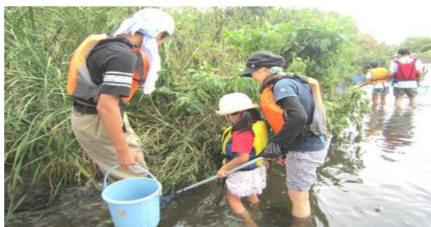
「小さなお魚さんがいるよ！」お母さんと一緒に、網ですくって取りました。