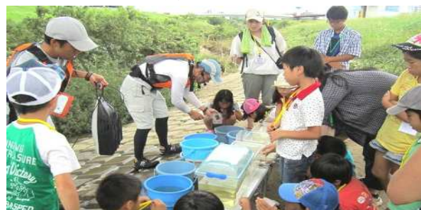
採取した生きものを種類別に分けて、流域センターの方からそれぞれ説明をいただきました。