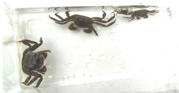
はさみの毛が逞しいモズク蟹（モズク蟹は間違い）です！ おおきなサワ蟹も取れました！