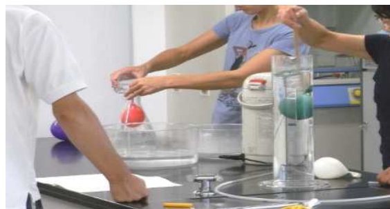
風船を使って、シリンダー内での浮き沈み実験や、口の小さなフラスコへの出し入れ実験です。水の比重や気圧を変えることが種なのです。