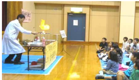
「燃料電池」 [横須賀会場] 水素ガスの燃焼実験。近い将来この水素が自動車の燃料になりそうです。燃焼によって排出されるのは水だけという、究極なクリーンエネルギーなのです！