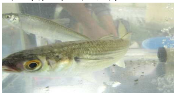
「魚とり」の講座名どおり魚も取れました。アブラハヤです。