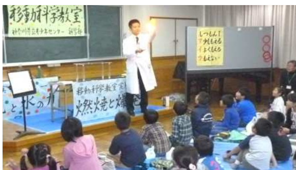
「燃焼と爆発」 [茅ヶ崎会場] 手品で使うフラッシュペーパーは良く燃えます。「燃える」って何だろう？ 改めて訊かれると…難しい。火を使った実験に子どもたちの歓声が起こります！