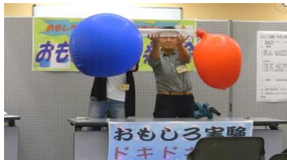
発表会です。大きな風船と小さな風船をつないでいる管の弁を外すと…あら不思議！どうなったと思いますか？同じ大きさに落ち着くと思うでしょう！プーです。