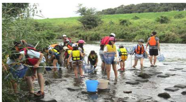
ひざ下まで水に浸かりながら、主に岸辺を中心に搜索しました。何があるのか楽しみです。

9月8日（日）小学生と保護者の方32名が、日産スタジアムの近くにある鶴見川流域センターを訪問しました。職員の方のご指導のもと、近くの鶴見川で魚を始めいろいろな生き物の採取を行いました。川の水もきれいで魚のほか蟹や亀などが取れました。午後は鶴見川流域センターの施設見学をしました。