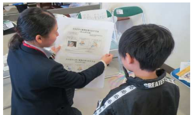
どのブースもスタッフの皆さんが、子どもの視線に立った丁寧で分かりやすい解説をしていただき、参加した方々から大変好評をいただきました。ありがとうございました。