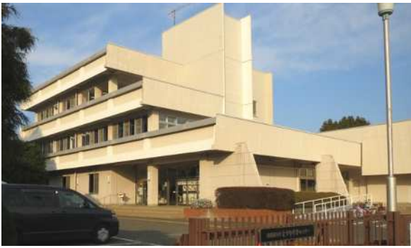
J R 横浜線矢部駅から至近の相模原市青少年学習センターで開催しました。