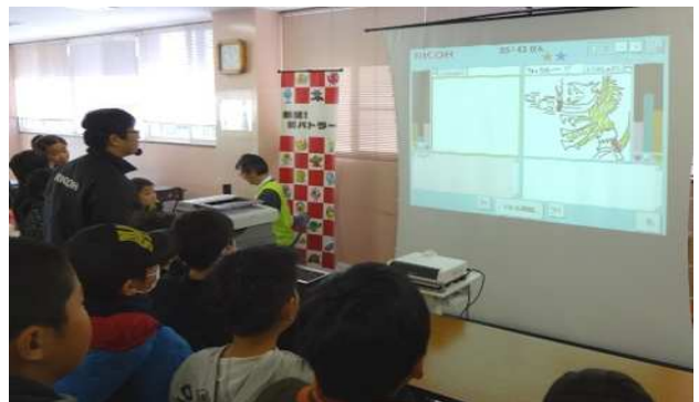
株式会社リコーによる「熱闘！紙バトラー」です。こちらも子どもたちに大人気です。