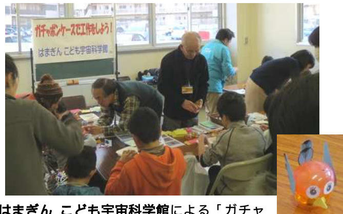
はまぎん こども宇宙科学館による「ガチャボン ケースで工作しよう」です。とてもかわいい鳥さんができました。