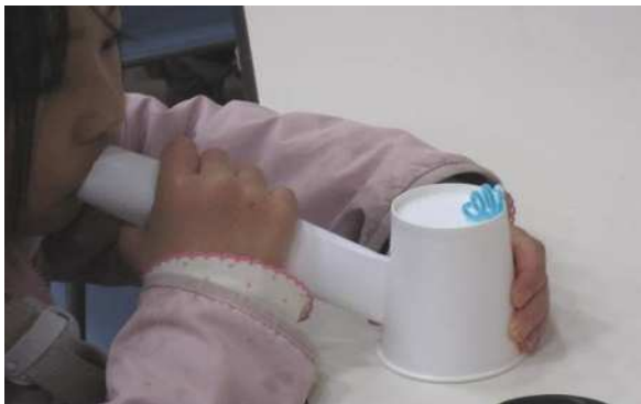
さがみはら科学探検隊による「音で遊ぼう」です。紙コップの底の振動で声が変わります。