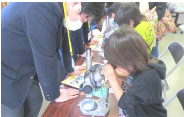
県立相模原青陵高校地球惑星科学部による「神奈川の大地から金!?や宝石などを取り出そう」です。子どもたちの鉱物に対する関心を引き出します。