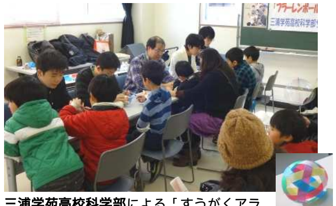
三浦学苑高校科学部による「すうがくアラカルト」です。フラーレンボールを教わりました。うれしいお土産ができました。