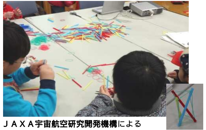
JAXA宇宙航空研究開発機構による「たたんでひろげる宇宙構造物」の工作です。いろいろな面での宇宙研究が実感できました。