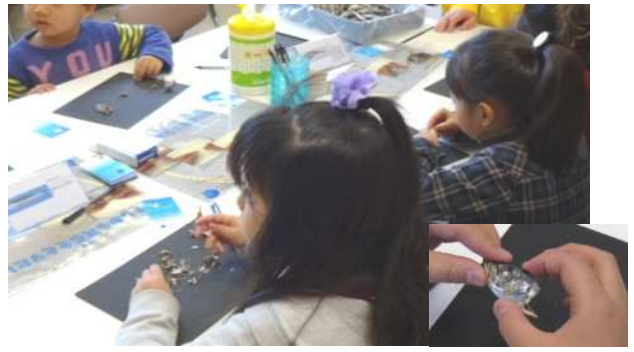
(独)水産総合研究センターによる「煮干しから耳石を取り出してみよう」です。解剖体験ができました。取り出した耳石はラミネートしてお土産に。