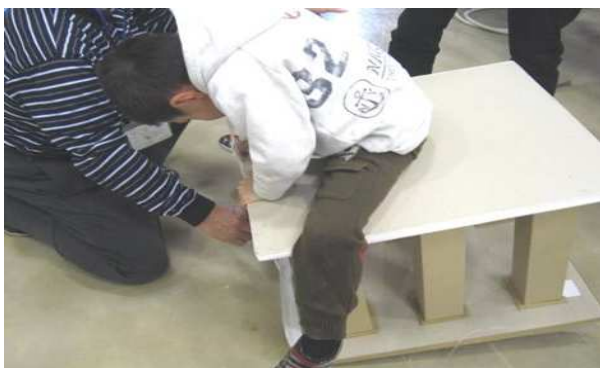
神奈川県環境学習リーダー会による「挑戦！君は自分の呼気で自分の体を持ち上げられるか」です。意外と楽に持ち上がりました。気圧ってすごい。