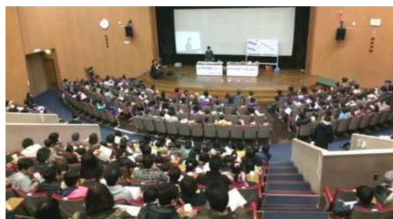
満席の子どもたちの反応はとても大きい。