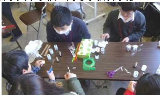
今は珍しいフィルムケースとアルミホイルで電池がいらないモーターを作ります。