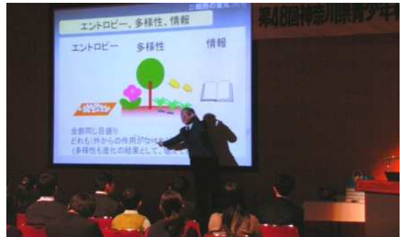
最先端の研究を分かりやすくお話いただき、子どもたちは本物に触れることができました。