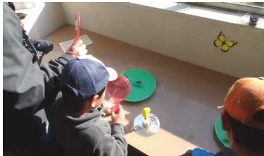
手鏡で太陽光を当てると動き出すおもちゃの展示もありました。