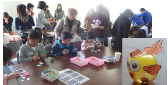
予定数を大幅に超える 351 名が参加しました。