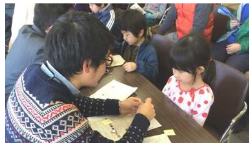
電気が通ると LED が光ります。高校生のお兄さんが丁寧に教えてくれました。