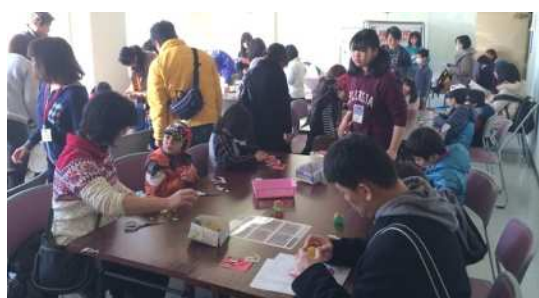
ガチャボンケースをリサイクルしてかわいい小鳥のおきあがりこぼしを作りました。