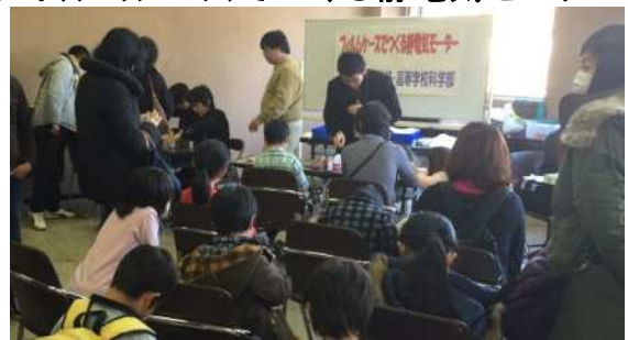
静電気だけでビュンビュン回ります。科学好奇心にあふれる子どもたちが順番待ち。