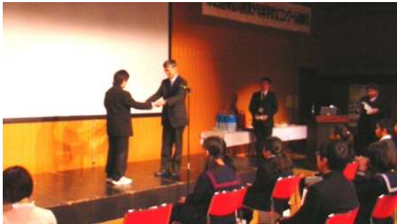
各賞の受賞です。お一人ずつ各団体の代表者から授与されました。