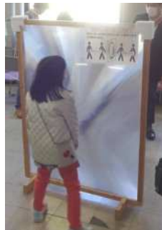
近づいたり離れたり...何が見えた？