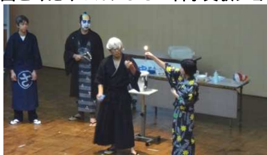
悪代官や忍者などに扮した熱血実験ショー。