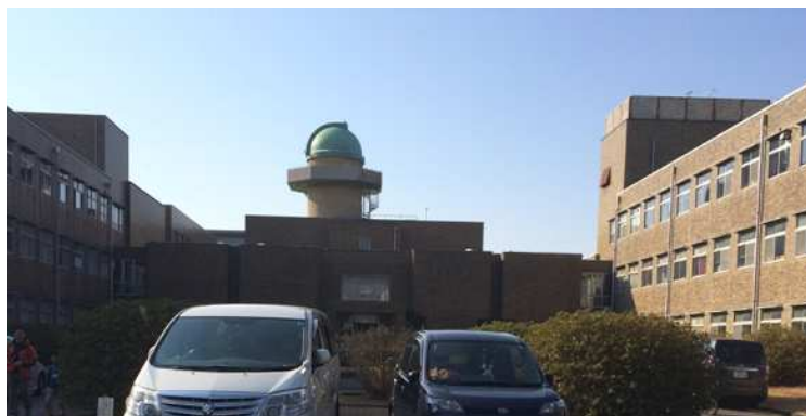
普段は学校の先生の研修施設である県立総合教育センターですが、この日は一日中、子どもたちの熱気であふれていました。