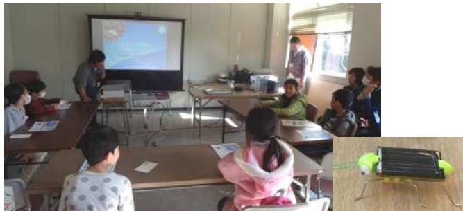
事前申し込み制による「ソーラーバッタ」の工作教室が開催されました。光を当てるとブルブル振動します。