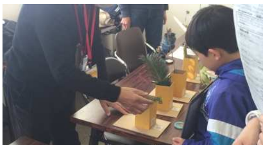
植物の不思議を発見して、その原因を推理しました。不思議な植物があります。