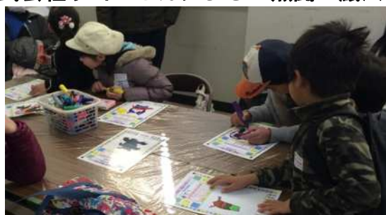
カラーペンでモンスターを描きます。