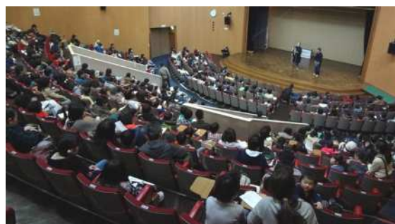
こちらも満席！ 関心の高さが伺われます。