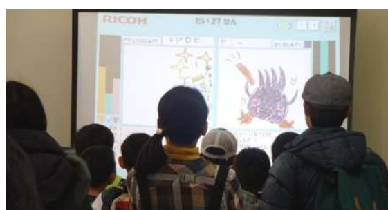
スクリーン上で熱戦が繰り広げられました。