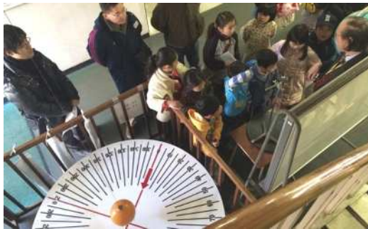
小学生に地球の自転の証明方法を分かりやすく説明いただきました。