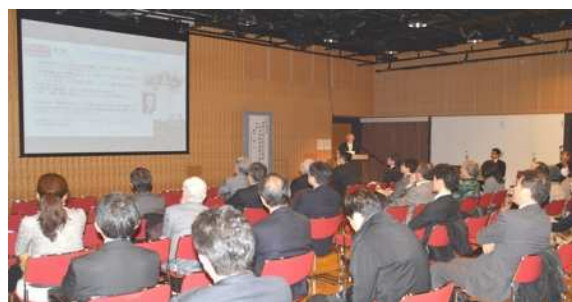
鉄道発祥の国イギリスへ高速鉄道車両を輸出する日本の技術に誇りを感じます。