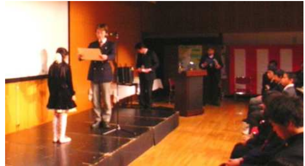
それぞれの賞に相応しい作品が選ばれました。どれも素晴らしい作品でした。