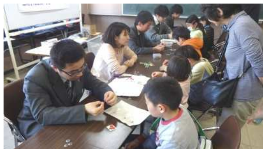
電池と LED、抵抗をつないで電気が通るかを確認するチェッカーを作りました。