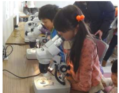
顕微鏡で植物の細胞や微生物を観察しました。