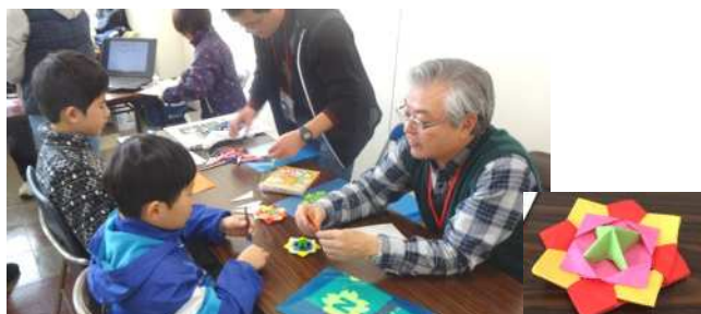
不思議できれいな花の折り紙工作を体験しました。