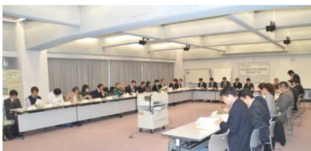
報告事項や協議事項において、貴重なご意見やご感想をいただきました。