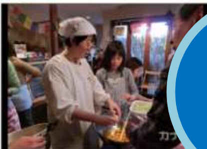
鎌倉市「ふらっとカフェ」のメンバーと子どもたち。

子どもから高齢者までの食卓を囲んで楽しむ「ふらっとカフェ鎌倉」が鎌倉市内でスタートした。NPO法人子どもと大人の協力で「食事付き寺子屋」を目指し、読書や配膳など食の準備が完了したら入会費をいただく。