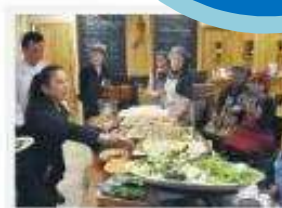
鎌倉市の「ふらっとカフェ」のメンバー。

「食べきれない」「使う予定がなくなり……。こういった家庭で余っている食品を募り、福祉活動団体に寄付する「フードドライブ」を9月24日（日）から29日（金）まで鎌倉市（初日は受付なし）とNPO法人鎌倉リサイクル推進協議会が協賛事業の一環として実施する。