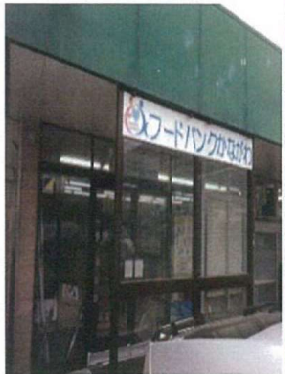
フードバンクかながわ