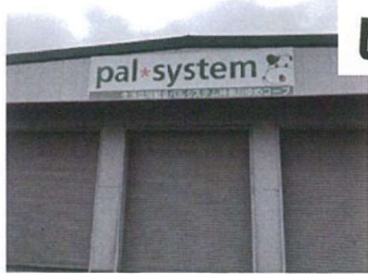
ビーバーリンク鶴見