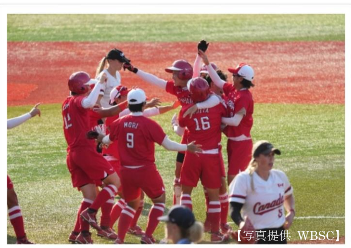
サヨナラヒットに喜びを爆発させる代表メンバー