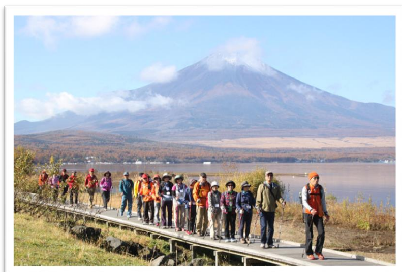
山中湖でノルディックウォーキングを楽しんでいるクラブの皆さん

現在、横浜市都筑区の「都筑 NW クラブ」と青葉区の「青葉 NW クラブ」の 2 つのクラブを運営していて、