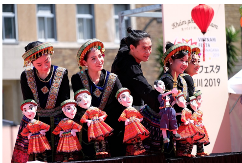
ベトナムフェスタ in 神奈川 2019