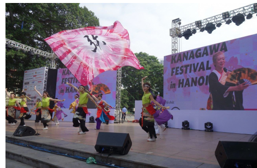
KANAGAWA FESTIVAL in HANOI 2019