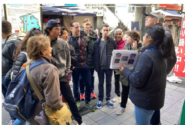
かながわ認定観光案内人 (イメージ) (Official Kanagawa Tour Guide)

講座を受講し、外国人観光客向けの旅行商品を企画・販売した者について、専門家や有識者による審査を経て「かながわ認定観光案内人 (Official Kanagawa Tour Guide)」として認定する。