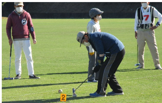
ゲートボールリハーサル大会の様子