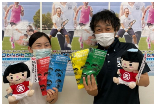
プレゼントキャンペーンの景品