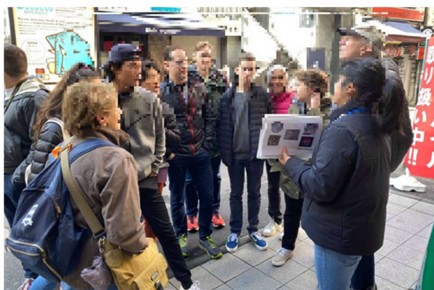
かながわ認定観光案内人 (イメージ) (Official Kanagawa Tour Guide)

講座を受講し、外国人観光客向けの旅行商品を企画・販売した者について、専門家や有識者による審査を経て「かながわ認定観光案内人 (Official Kanagawa Tour Guide)」として認定する。