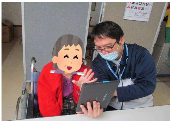
タブレットを使用したビデオ通話

⑤ 注意点 ・ラインを使用する際には、ご家族へのご案内資料を作成し配布する必要がある。(ご家族の中にはラインを使用したことが無い方もいらっしゃるなので、アプリインストールの仕方から友達追加の方法まで詳細な案内が必要。) ・職員の負担を抑えるため、事前に面会ルールを明確にした上で職員やご家族に共有する必要がある。(頻度や時間帯等)