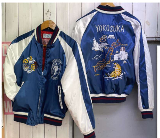
オリジナルスカジャン

スカジャンをはじめとした商店街独自の商品や文化等を発信する機会を作り、継続的な賑わい創出に向けて取り組んでいる。