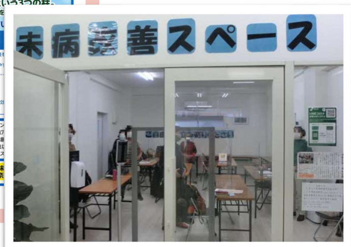
イベント実施スペース