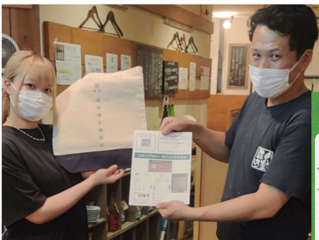
スタンプラリー景品

コロナ禍でも手段や実施方法などを工夫することで、商店街の魅力アップや課題解決につながる、商店街の体制作りやイベントを実施した。