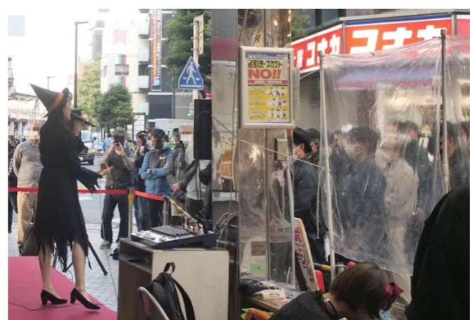
バスカーライブ（秋祭り）