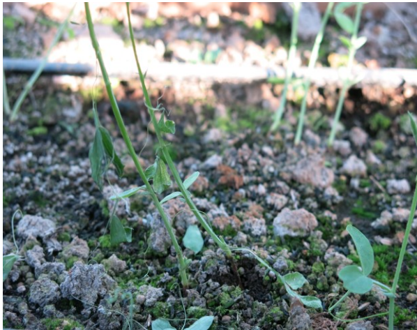
図1 地上部の萎凋症状