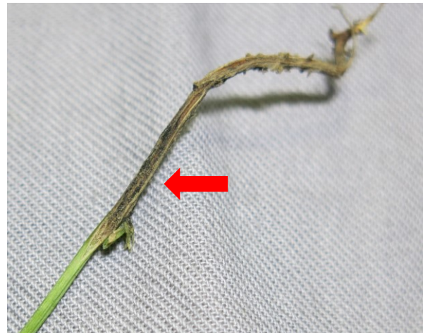
図2 厚膜胞子の形成による主茎地際部の黒変症状