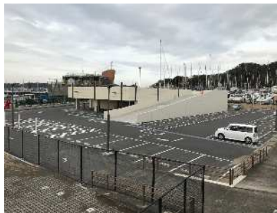
F 臨港道路附属駐車場