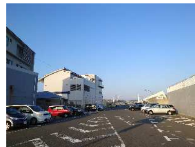
F 臨港道路附属駐車場