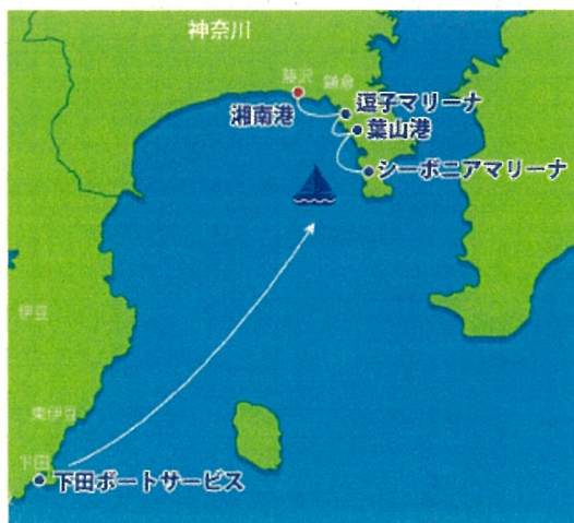
当社グループマリーナ

実務において、ベテランスタッフと若手スタッフがペアを組みOJT指導を行うことで、次世代のスタッフを育成しています。