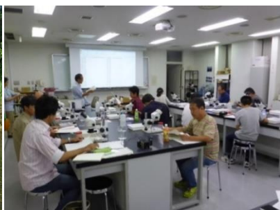
生物採集技術講習会の様子 生物同定技術講習会の様子

問合せ先 〒254-0014 平塚市四之宮1-3-39 神奈川県環境科学センター 調査研究部 水源環境担当(長谷部) TEL: 0463-24-3311 内線314