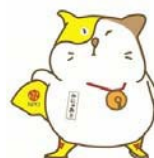
いいにゃクリエイター かになお