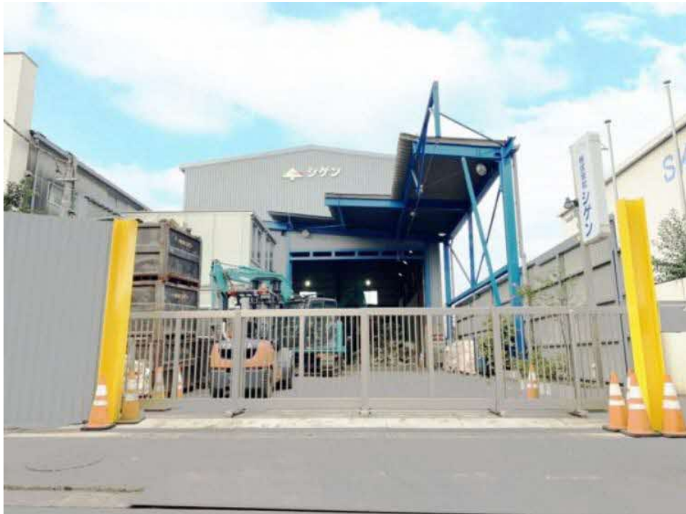
中間処理施設（横浜工場）