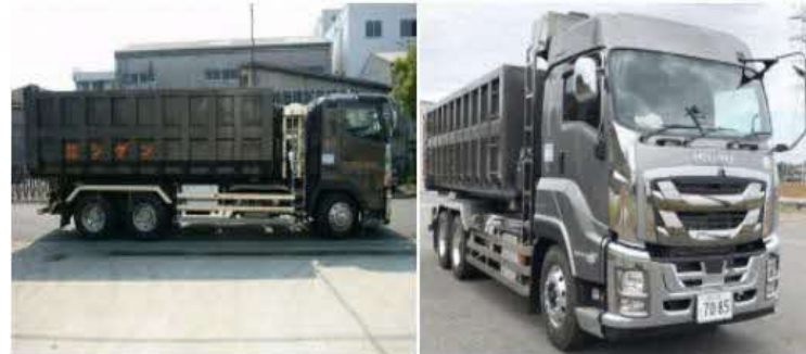
大型アームロール