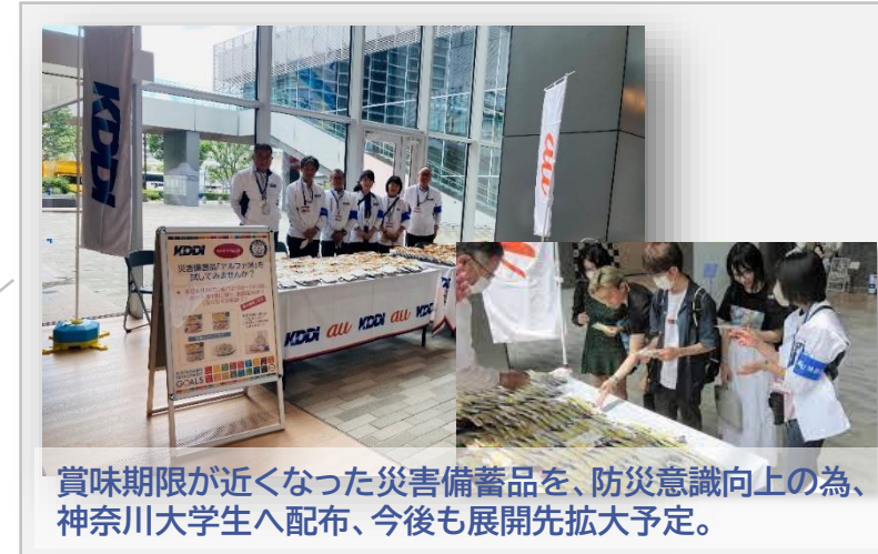
賞味期限が近くなった災害備蓄品を、防災意識向上の為、神奈川大学生へ配布、今後も展開先拡大予定。