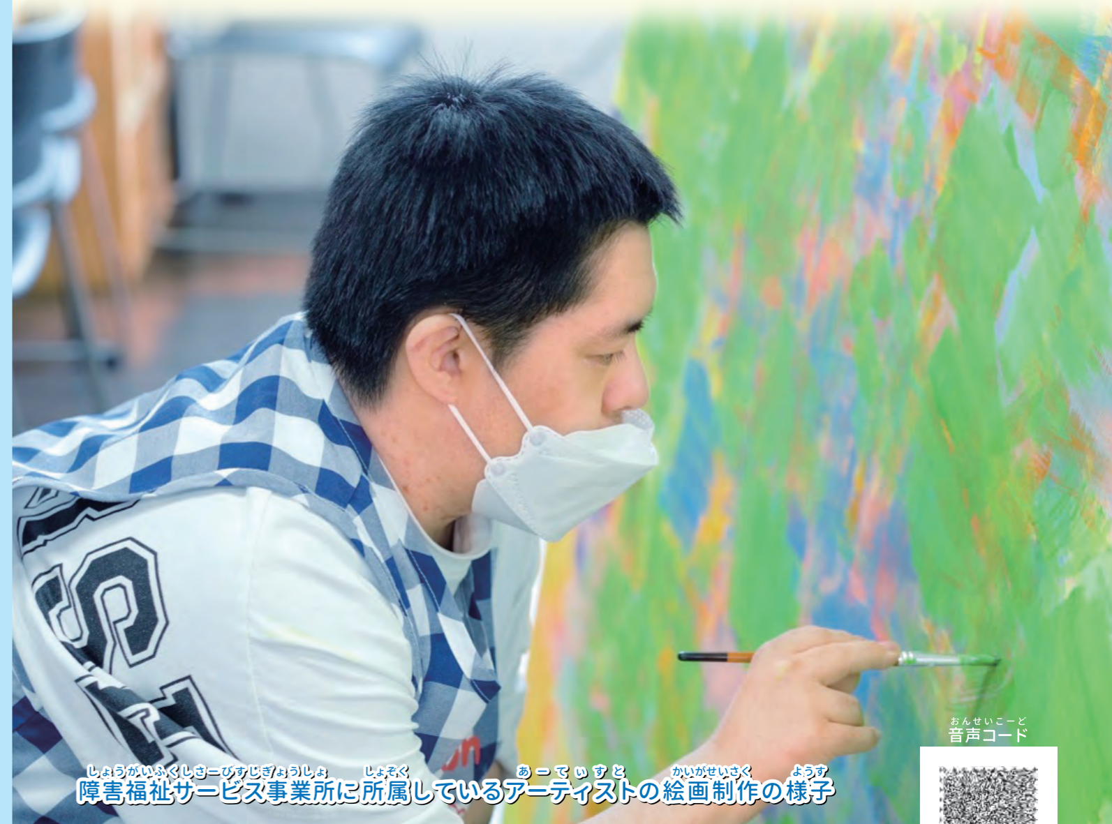
しょうがいふくしサービス事業所に所属しているアーティストの絵画制作の様子