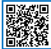
津久井治水センターホームページ