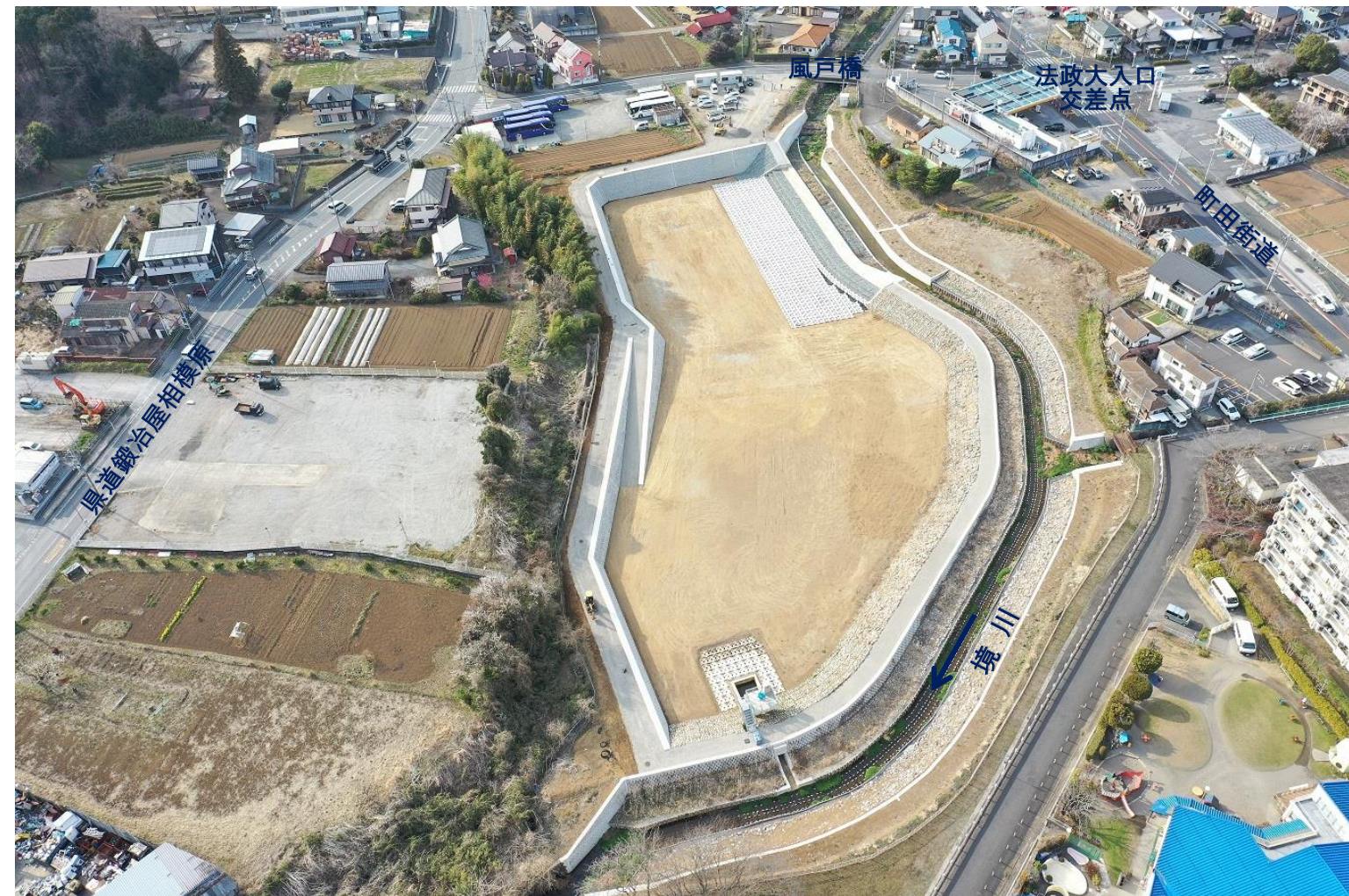
風間遊水地 令和4年3月撮影