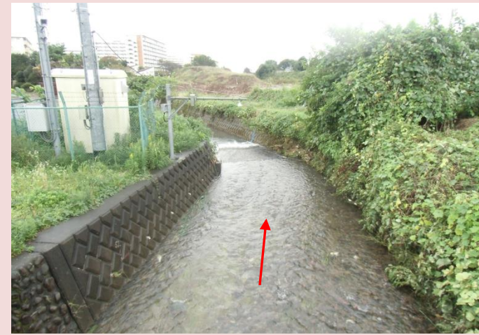
風戸橋下流（改修前）