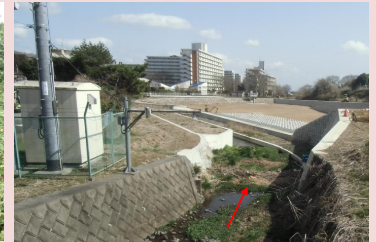
風戸橋下流（改修後）