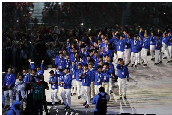
2019年夏季世界大会・アブダビ 日本選手団入場行進

夏季競技・冬季競技のワールドゲーム(世界大会)に選手団を 派遣 ※2023年6/16(金)~25(日)ベルリンで開催