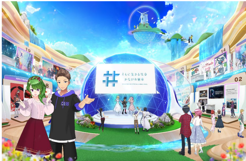
【ワールドイメージ】