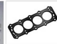
シリンダヘッド ガスケット