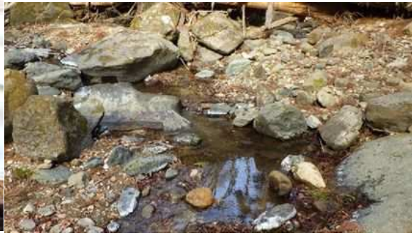
図 2 : 採捕場所 (物見沢)