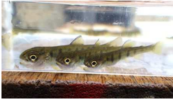
図 1 : 採捕されたヤマメ稚魚