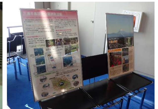
(三浦半島地域における広報活動)

三浦半島国営公園設置促進期成同盟会 神奈川県 横須賀市 逗子市 三浦市 葉山町 神奈川県市長会 神奈川県町村会 横須賀商工会議所 逗子市商工会 三浦商工会議所 葉山町商工会 事務局：神奈川県県土整備局都市部都市公園課 〒231-8588 横浜市中区日本大通1 電話：045-210-1111 (代表)