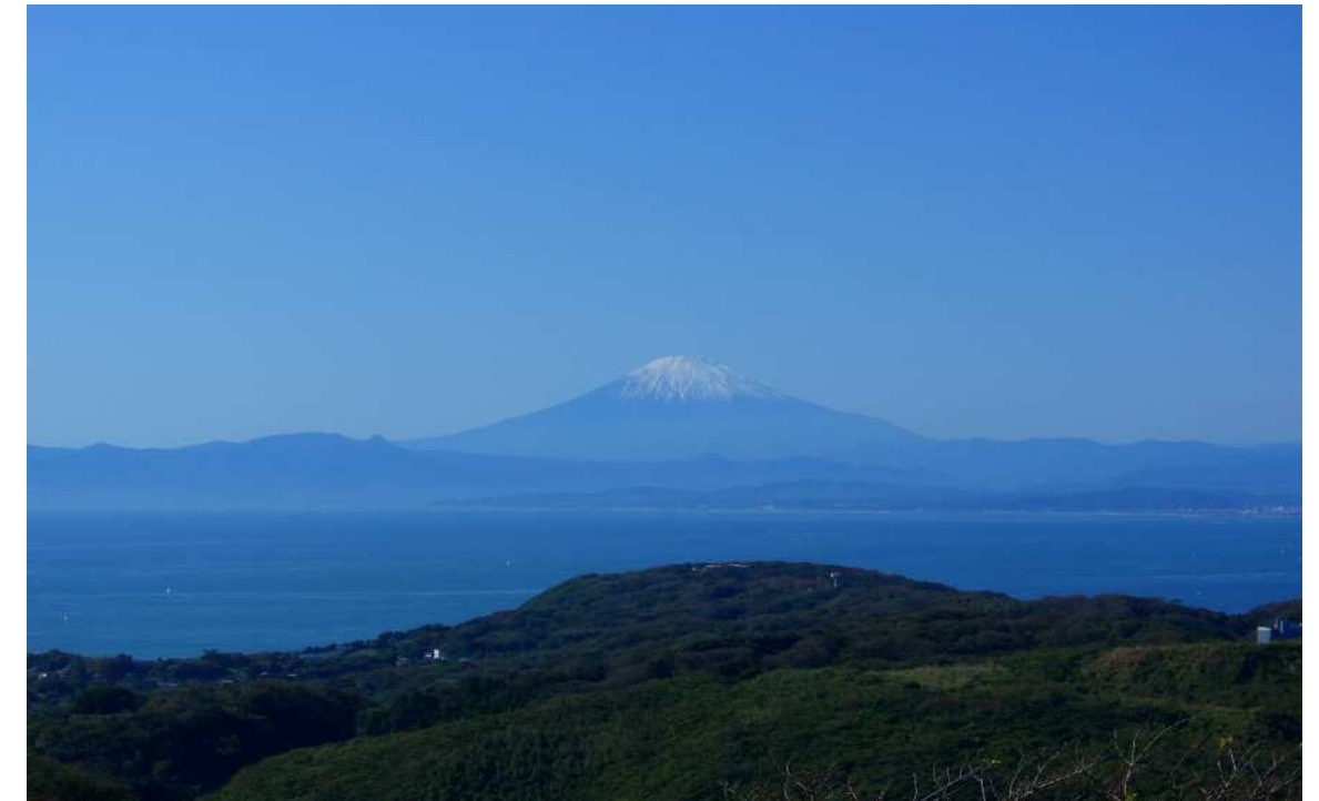
(大楠山の展望台より望む富士山)