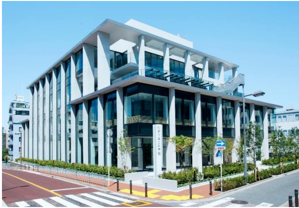
県立図書館本館（令和4年9月開館）