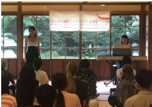
かながわ国際ファンクラブ交流会 2022