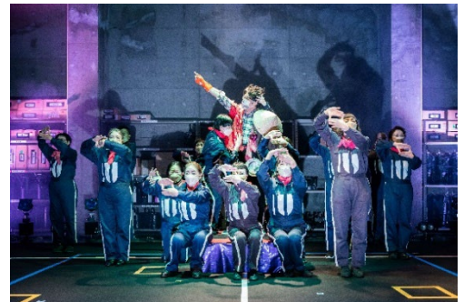
シニア劇団による公演