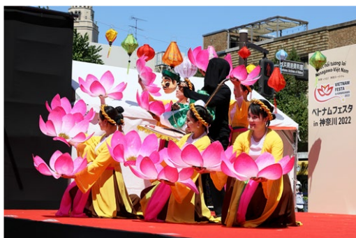
ベトナムフェスタ in 神奈川 2022