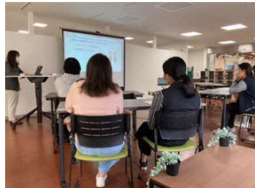
留学生就職支援講座