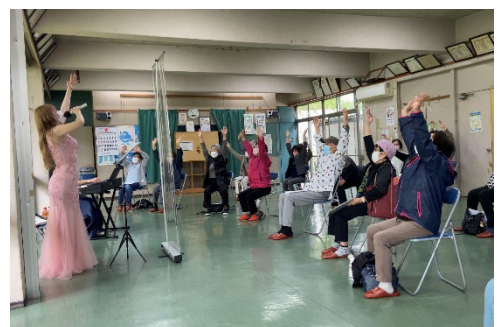
合唱レッスンの様子