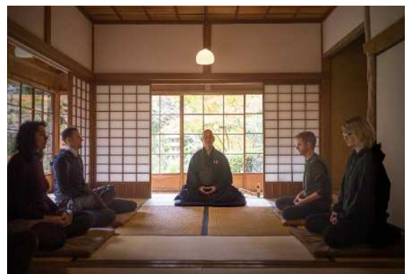
⑩ 海外の旅行会社を対象としたプロモーション