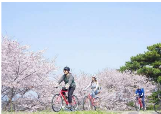
⑦～⑫ 観光客誘致のためのプロモーション