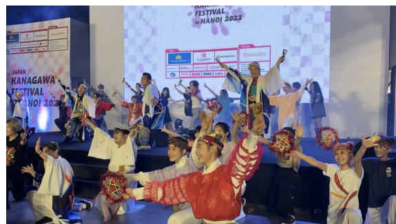
KANAGAWA FESTIVAL in HANOI 2022