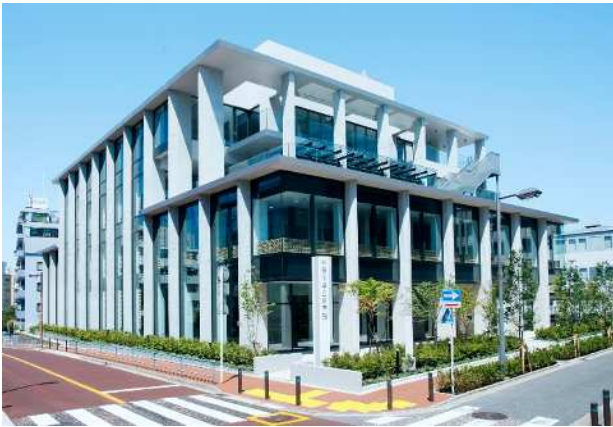
県立図書館本館（令和4年9月開館）