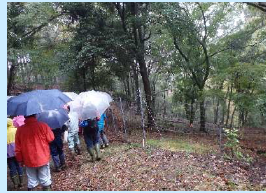
水源の森林づくり事業（厚木市） ＜植生保護柵を視察＞