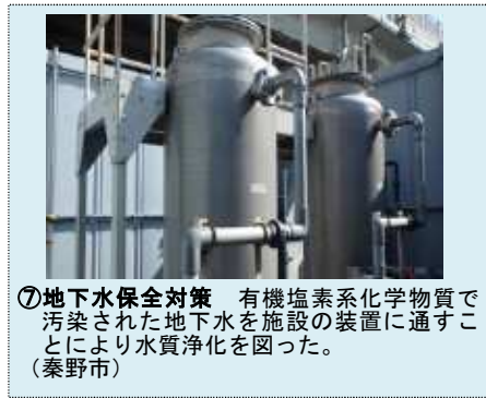
⑦地下水保全対策 有機塩素系化学物質で汚染された地下水を施設の装置に通すことにより水質浄化を図った。(秦野市)