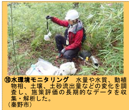
⑩水環境モニタリング 水量や水質、動植物相、土壌、土砂流出量などの変化を調査し、施策評価の長期的なデータを収集・解析した。(秦野市)