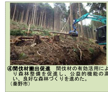
④間伐材搬出促進 間伐材の有効活用により森林整備を促進し、公益的機能の高い、良好な森林づくりを進めた。(秦野市)