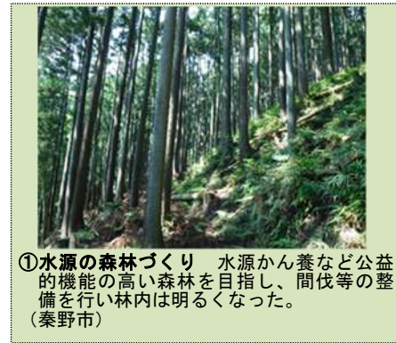
①水源の森林づくり 水源かん養など公益的機能の高い森林を目指し、間伐等の整備を行い林内は明るくなった。(秦野市)