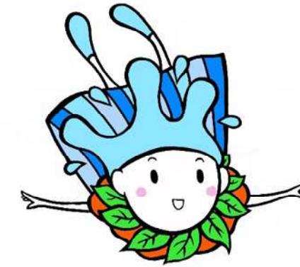
水源環境保全・再生 イメージキャラクター かながわ しずくちゃん

神奈川県では、水源環境保全税を財源として、水源地域の森林整備や生活排水対策などの事業（特別対策事業）を実施しています。