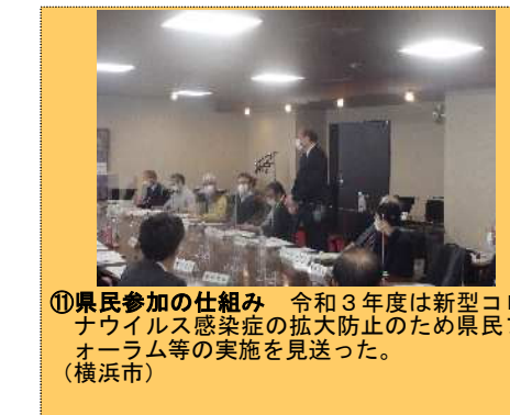
⑪県民参加の仕組み 令和3年度は新型コロナウイルス感染症の拡大防止のため県民フォーラム等の実施を見送った。(横浜市)