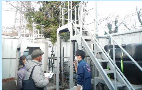
地下水保全対策事業（秦野市） ＜地下水浄化施設を視察＞