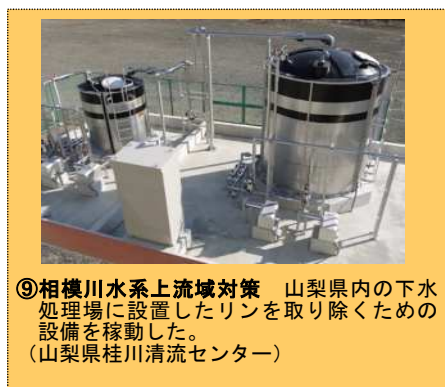
⑨相模川水系上流域対策 山梨県内の下水処理場に設置したリンを取り除くための設備を稼働した。(山梨県桂川清流センター)