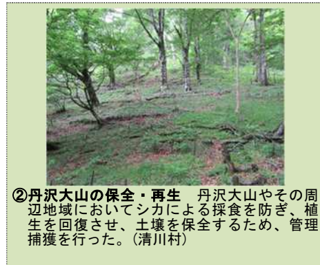
②丹沢大山の保全・再生 丹沢大山やその周辺地域においてシカによる採食を防止、植生を回復させ、土壌を保全するため、管理捕獲を行った。(清川村)