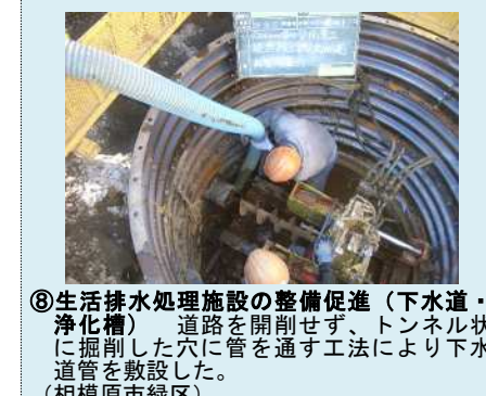
⑧生活排水処理施設の整備促進(下水道・浄化槽) 道路を開削せず、トンネル状に掘削した穴に管を通す工法により下水道管を敷設した。(相模原市緑区)