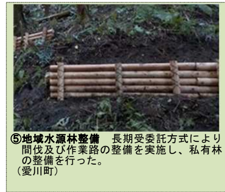
⑤地域水源林整備 長期受委託方式により間伐及び作業路の整備を実施し、私有林の整備を行った。(愛川町)