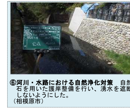
⑥河川・水路における自然浄化対策 自然石を用いた護岸整備を行い、湧水を遮断しないようにした。(相模原市)