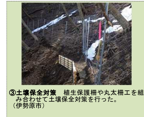
③土壌保全対策 植生保護柵や丸太柵工を組み合わせて土壌保全対策を行った。(伊勢原市)