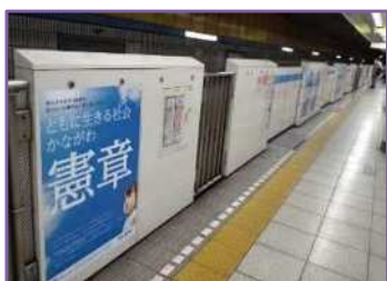
(1) 様々な媒体を活用した広報 ホームドア広告