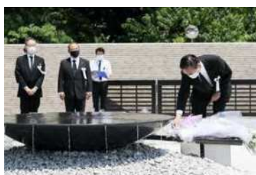
(6) 津久井やまゆり園事件追悼式 モニュメントでの献花