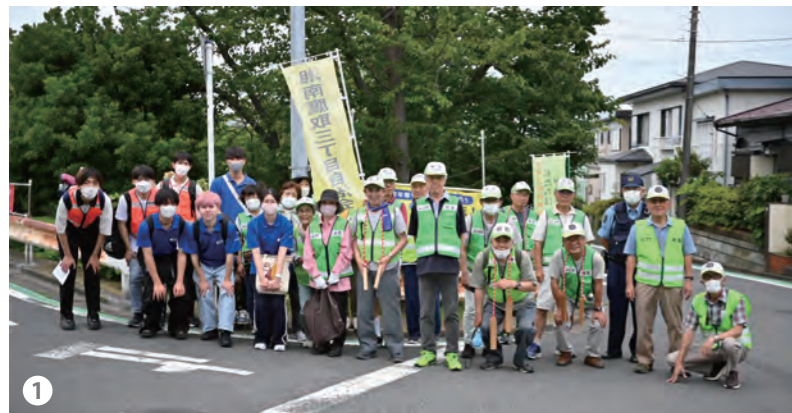
1 湘南鷹取防犯対策委員会 三丁目自治会の皆さま この日は、セーフティかながわユースカレッジのメンバーと活動しました!

湘南鷹取地区は、2,908世帯、人口は7,511人の閑静な住宅地。このうち、65歳以上の高齢者の割合は45%となっています。本地区には7つの自治会があり、各自治会から任命された総勢約50名の委員で構成される「湘南鷹取防犯対策委員会」が、日々各地区の防犯活動を実施しています。令和2年には、長年にわたる地道で広範な活動が評価され、「安全安心なまちづくり関係功労者表彰」の内閣総理大臣賞を受賞されています。