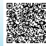
当日の様子は コチラ▲