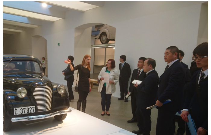
第48回 シュコダ・オート株式会社(チェコ) チェコ最大の自動車メーカー、「ミュージアムを見学」