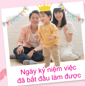
Ngày kỷ niệm việc đã bắt đầu làm được

Hàng ngày đều là ngày kỷ niệm việc nào đó bé đã bắt đầu làm được! Có thể lưu giữ kèm ảnh về "Việc đã bắt đầu làm được" của bé ví dụ việc "Bám đồ đạc để đi".