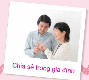
Chia sẻ trong gia đình

Ghi lại một cách đơn giản cân nặng của mẹ khi mang thai cũng như tốc độ phát triển của bé và thể hiện trên biểu đồ! Nhìn qua là có thể thấy được mức độ phát triển.