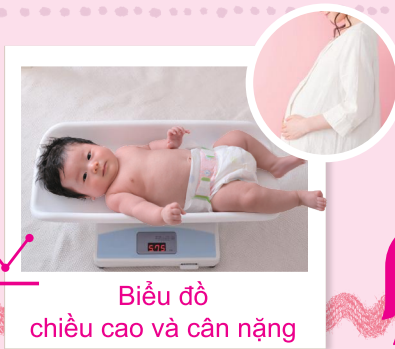
Biểu đồ chiều cao và cân nặng

Hàng ngày đều là ngày kỷ niệm việc nào đó bé đã bắt đầu làm được! Có thể lưu giữ kèm ảnh về "Việc đã bắt đầu làm được" của bé ví dụ việc "Bám đồ đạc để đi".