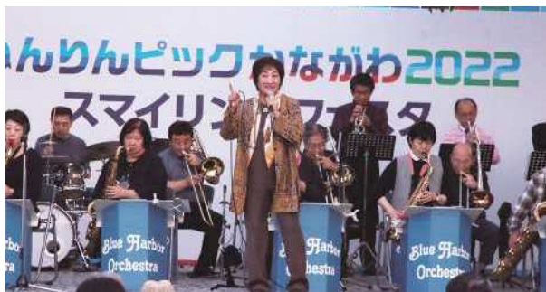
ブルーハーバーオーケストラの皆さん ビッグバンドジャズ演奏