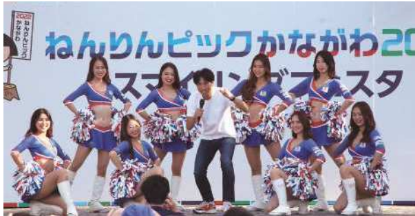
横浜F・マリノス オフィシャルチアリーダース トリコロールマーメイズの皆さん プロスポーツチームチアダンス