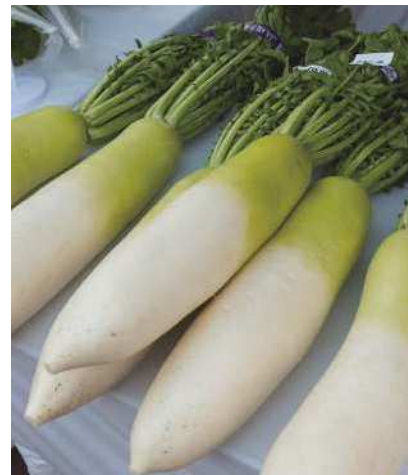
かながわねりんマルシェ