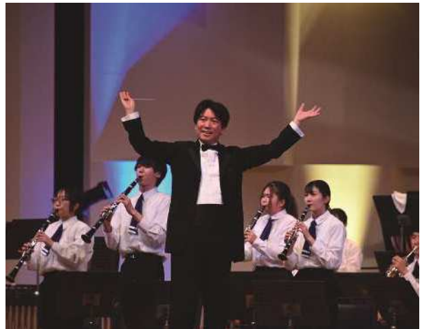
県立神奈川総合高等学校 吹奏楽部（吹奏楽）