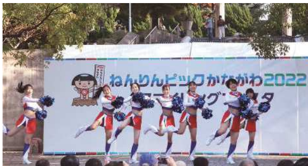
トリコロールマーメイズチアリーディングスクール リトルマーメイズの皆さん チアダンスパフォーマンス