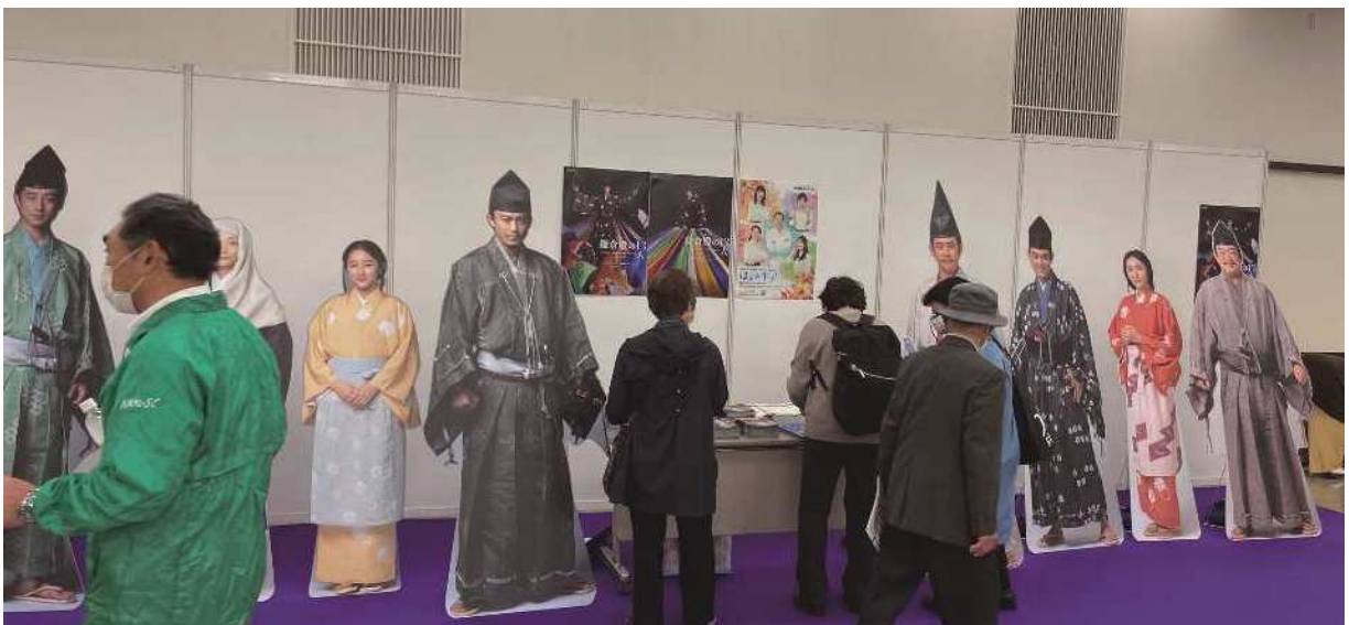
大河ドラマ「鎌倉殿の13人」パネル展（NHK 横浜放送局主催）