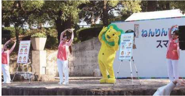
ライオン歯科衛生研究所の皆さん かむ力・飲み込む力アップで家族みんなで健康に!かみかみゴクゴク体操