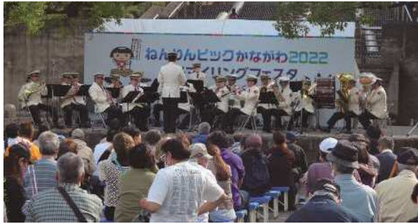
神奈川県警察音楽隊の皆さん 音楽隊による吹奏楽の演奏