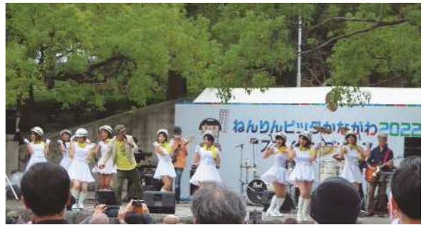
いとしのエリーズの皆さん サザンオールスターズ トリビュートバンド「いとしのエリーズ」による生演奏と専属ダンサーが華を添えるステージパフォーマンス