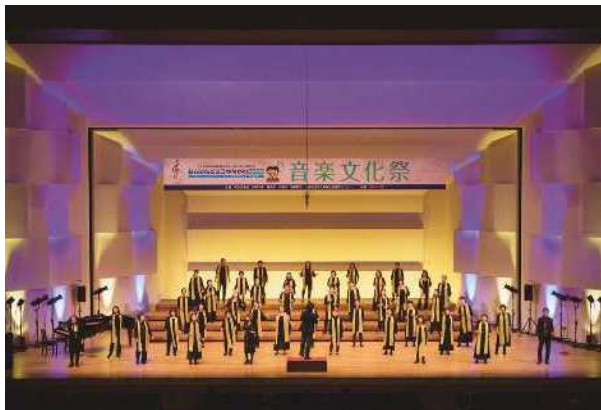
Rainbow Breeze Choir (ゴスペル)