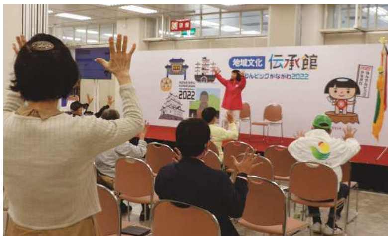
横浜産貿ホール ミニステージ