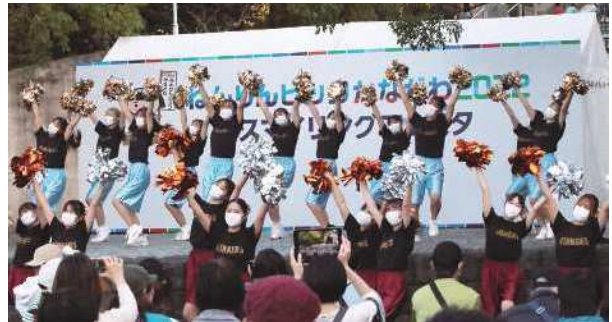
神奈川県バトン協会（合同演技チーム）の皆さん バトントワリング・ポンポン演技