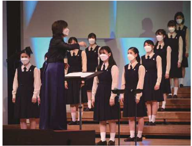
清泉女学院中学・高等学校 音楽部（合唱）