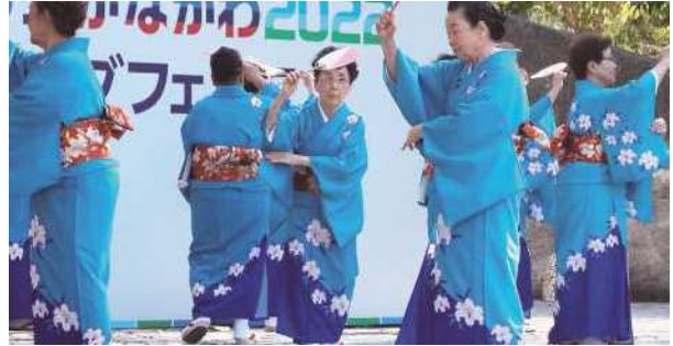
神奈川県支部民謡連盟の皆さん 瓜生野盆踊り・三崎甚句・長崎盆踊り等の日本民謡の披露