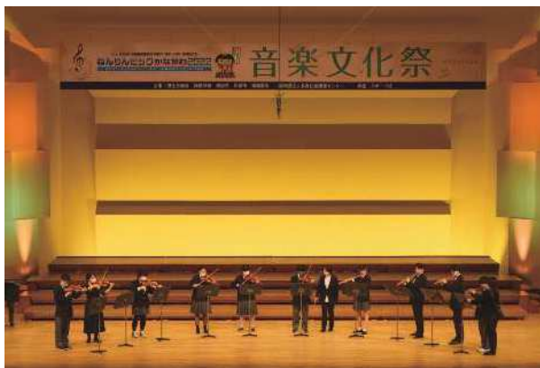
県立高津養護学校 分教室 音楽部 (合奏)