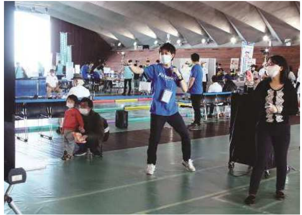
Fit Boxing 2