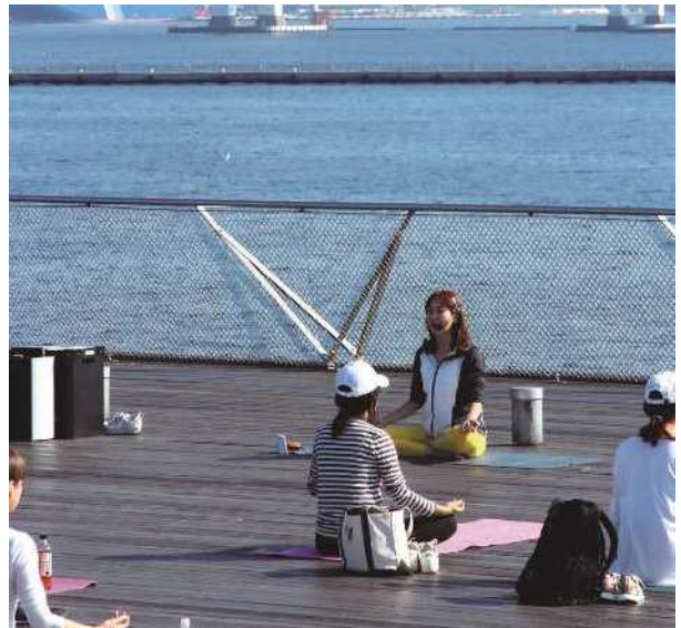
ねんりんスマイリングヨガ