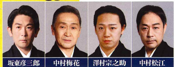
坂東彦三郎 中村梅花 澤村宗之助 中村松江