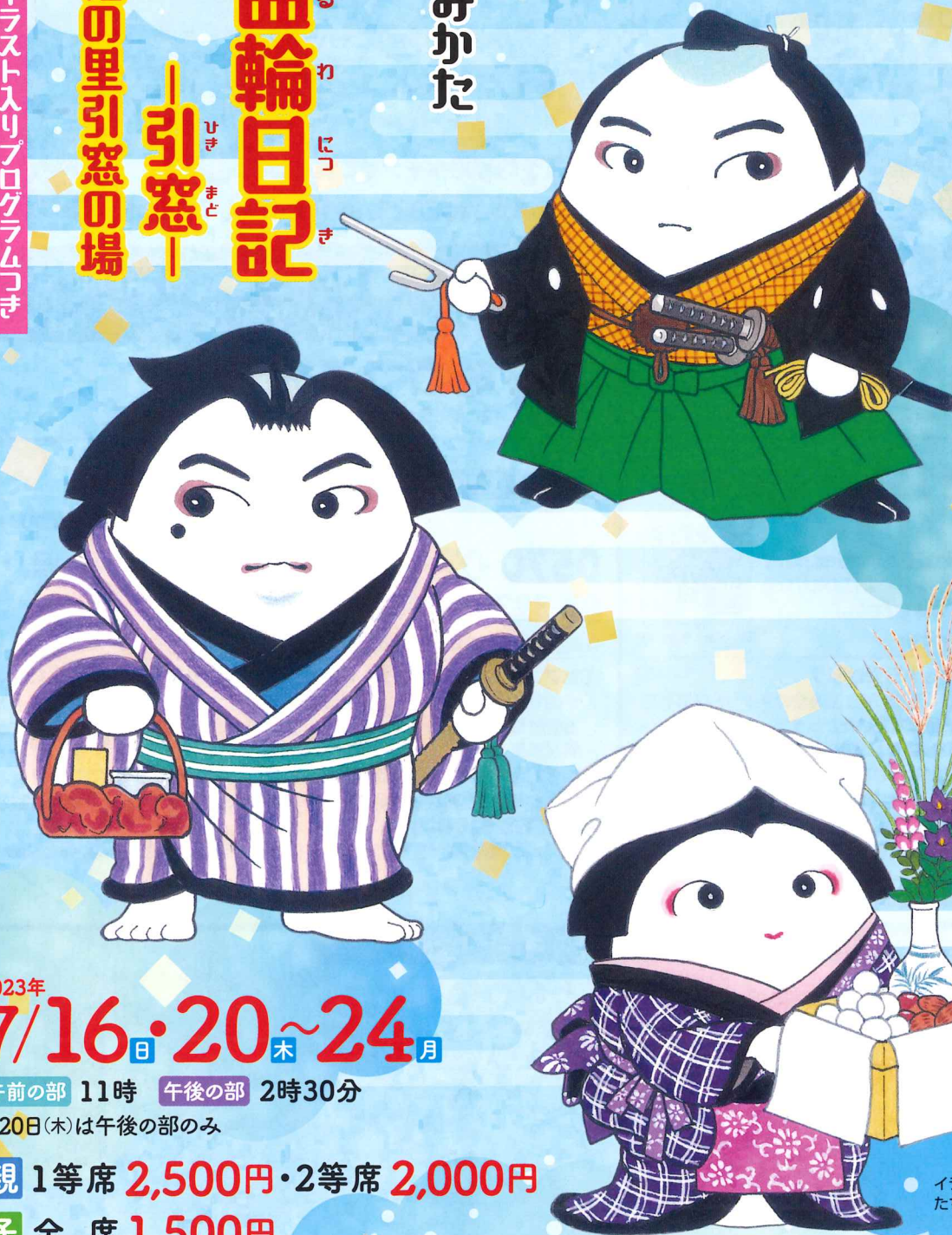
イラスト たちいりハルコ

わかりやすい「解説歌舞伎のみかた」と、 魅力いっぱい歌舞伎の名作を上演！（竹本の詞章の字幕表示が「ございます」）