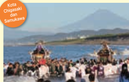
Kota Chigasaki dan Samukawa

Ini adalah peristiwa bersejarah yang mengisahkan kedatangan musim panas, dengan kedatangan fajar, 40 mikoshi dari kuil-kuil di Kota Chigasaki dan Kota Samukawa berkumpul di pantai dan meneriakan suara "dokkoi, dokkoi", sesuatu yang khas untuk Soshu sambil tandu yang diusung ditabrakan satu sama lainnya dengan keras.