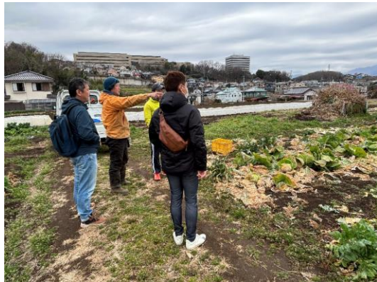
移住ツアー(イメージ)