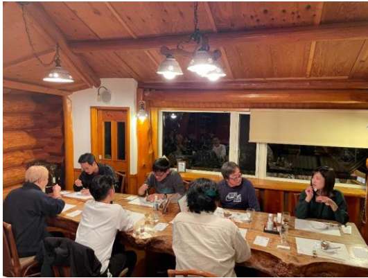
先輩移住者との交流会(イメージ)