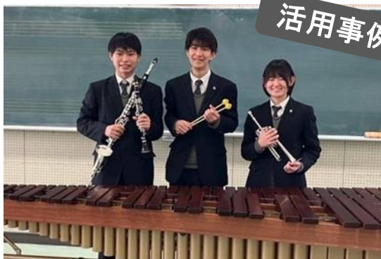
平塚中等教育学校の楽器の購入