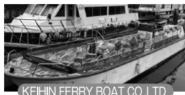
KEI-HIN FERRY BOAT CO.LTD