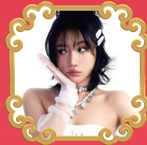
Special guest ORANGE

Mở rộng kết nối giao lưu ~ Việt Nam tươi đẹp ~