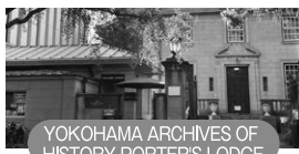
YOKOHAMA ARCHIVES OF HISTORY PORTER'S LODGE