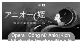
Opera Công nữ Anio Kịch kể chuyện âm nhạc đặc biệt