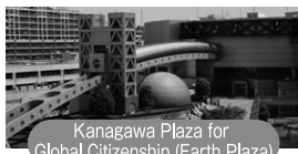
Kanagawa Plaza for Global Citizenship (Earth Plaza)