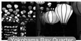
Yokohama Bay Quarter