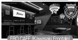
FRO CAFE (Kawasaki Frontale)