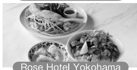
Rose Hotel Yokohama