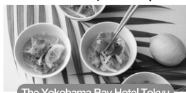
The Yokohama Bay Hotel Tokyu