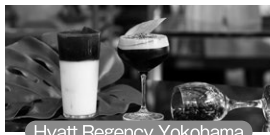
Hyatt Regency Yokohama