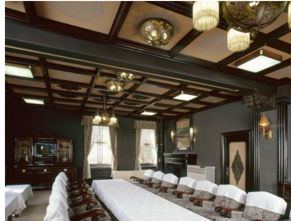
撮影場所:〇〇 説明:△△△△△△△△△△△△△△△△△△ △△△△△△△△△△