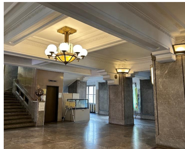
撮影場所:〇〇 説明: △△△△△△△△ △△△△△△△△ △△ △△△△△△△△ △△△