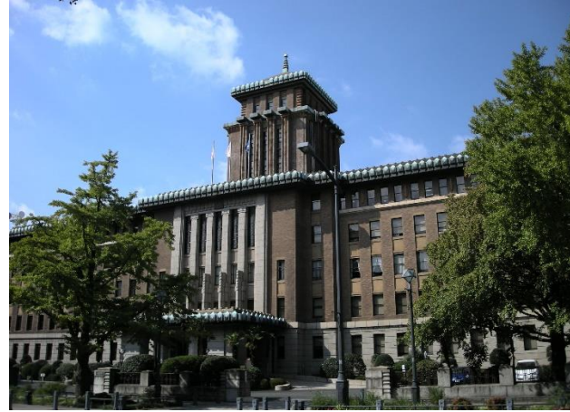
撮影場所:〇〇 説明:△△△△△△△△△△△△△△△△△△ △△△△△△△△△△