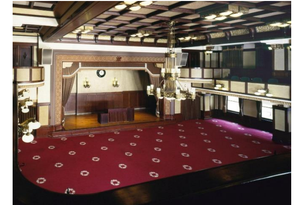
撮影場所:〇〇 説明:△△△△△△△△△△△△△△△△△△ △△△△△△△△△△