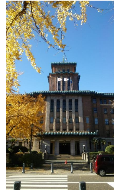
撮影場所:〇〇 説明: △△△△△△△△△△△△ △△△△△△△△ △△△△△△△△△△△△