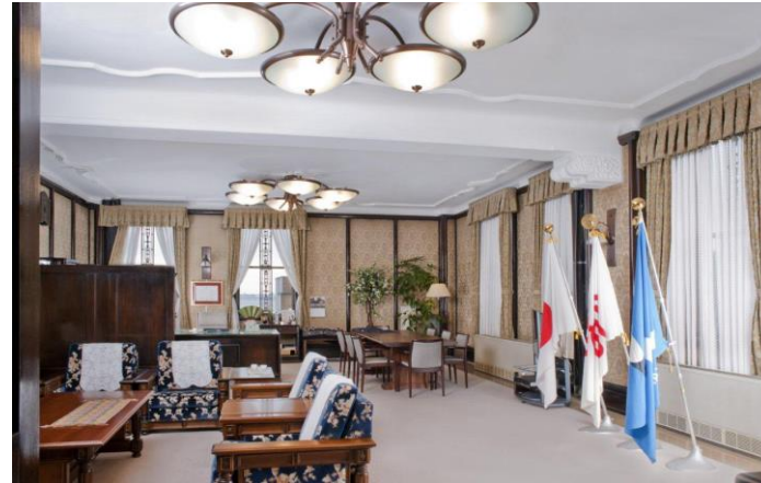
撮影場所:〇〇 説明:△△△△△△△△△△△△△△△△△△ △△△△△△△△△△