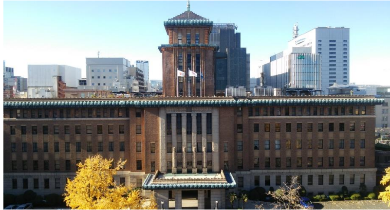
撮影場所:〇〇 説明:△△△△△△△△△△△△△△△△△△ △△△△△△△△△△