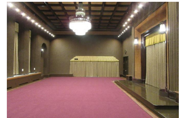
撮影場所:〇〇 説明:△△△△△△△△△△△△△△△△△△ △△△△△△△△△△