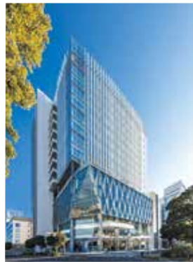
第65回一般建築物部門最優秀賞「関東学院大学 横浜・関内キャンパス」

第65回神奈川建築コンクールの入賞作品が決定しました。HPで紹介していますのでご覧ください。 ☎県建築安全課 ☎045(210)6255