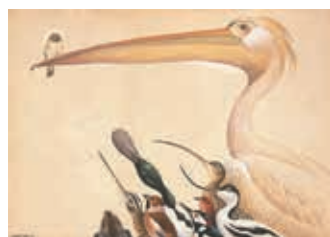
藪内正幸美術館所蔵