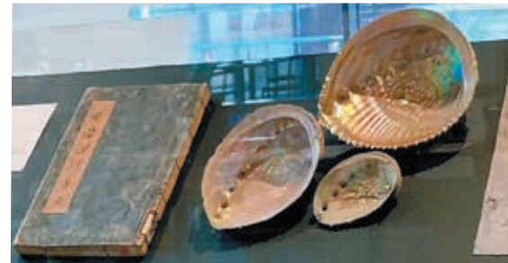
表紙にアワビや夜光貝がすき込まれた『俳諧深川集』