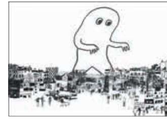
鎌倉別館企画展より 小金沢健人《ドローイング／シネマ(佐野繁次郎の素描に基づく変奏)》2023年作家蔵