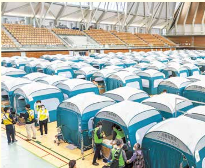
能登半島地震の際に避難所用テントが設置された様子